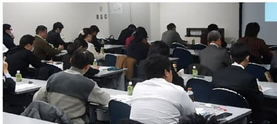
技術セミナーの風景