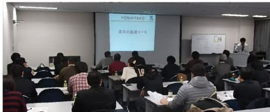
技術セミナーの風景